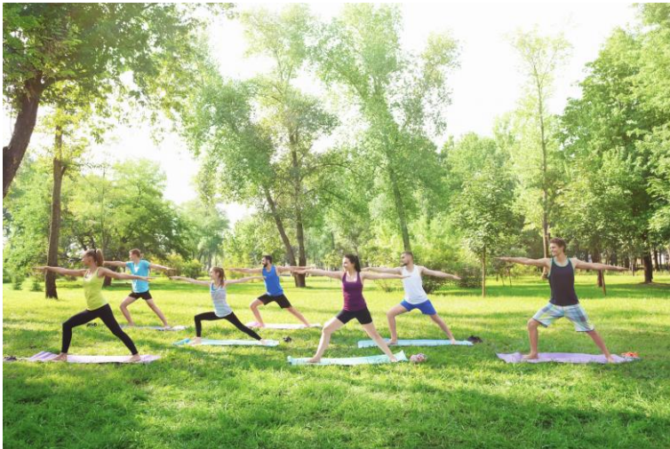
Bildhinweis: Yoga-Angebot von pro move beim AuGartln